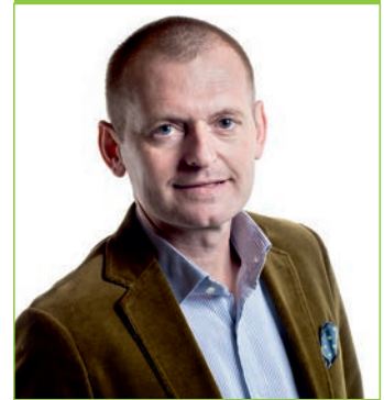
Dir. Bernhard Braunstein

Am 01.01.2015 wird Gleisdorf mit seinen vier Geschwistergemeinden Labuch, Laßnitzthal, Nitscha und Ungerdorf fusionieren. Damit verlieren bis zur nächsten Gemeinderatswahl im März 2015 alle politischen Mandatäre (GemeinderätInnen, Vorstands- und Stadtratsmitglieder, Vize- und BürgermeisterInnen) Kraft Gesetz, das in der Steiermärkischen Gemeindeordnung festgeschrieben steht, ihre Funktionen.