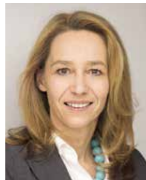
Tamara Niederbacher Finanzstadträtin

Darum und weil uns doch immer wieder die Bitte erreicht, doch mehr Beleuchtung aus Sicherheitsgründen zu ermöglichen, werden wir als verantwortungstragende Kraft in unserer Stadtgemeinde Sie im Herbst dieses Jahres mit einer erneuten Umfrage um Ihre Meinung bit-